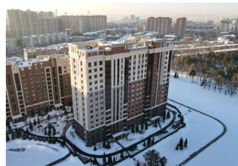
ЖК «Переулок бульварный»