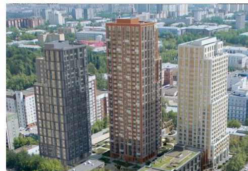
ЖК «Discovery Residence»