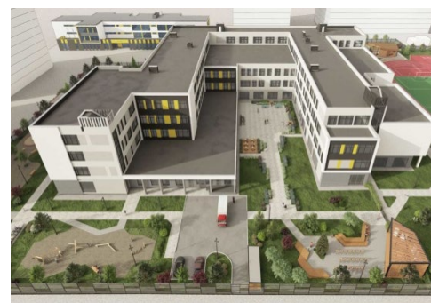
СОШ №215 «Созвездие»