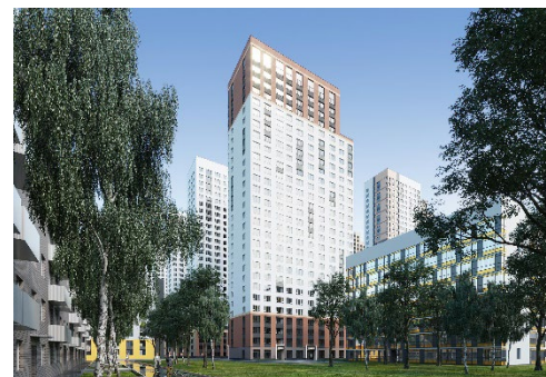
ЖК «На Фрунзе»