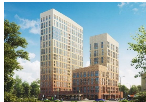
ЖК «Теплые кварталы»