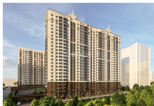
ЖК «Заельцовский NEW»