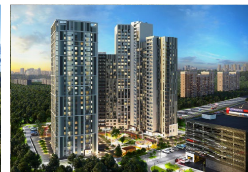
ЖК «Ботанический сад»