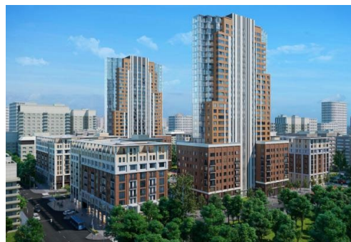
ЖК «Екатерининский парк»