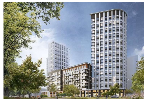
ЖК «Северное сияние»