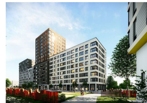
ЖК «Тайгинский парк»