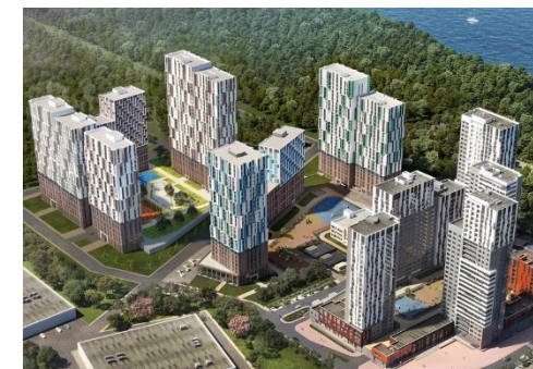
ЖК «Каменные палатки»