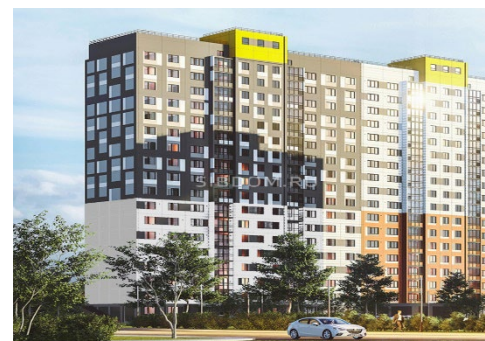
ЖК «Чистая слобода»