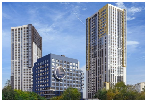
ЖК «Repin Tower»