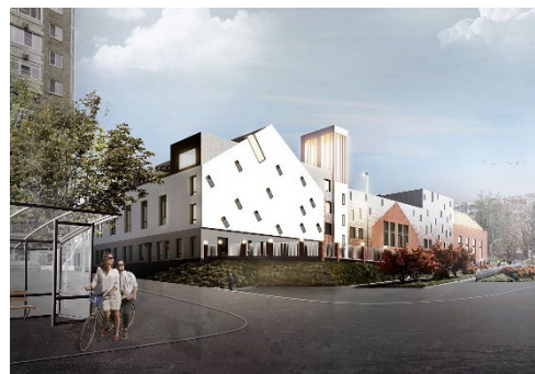
МАОУ СОШ №41